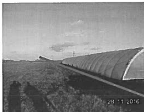
Értékelt ingatlanok határa a folia sáttorig tart.