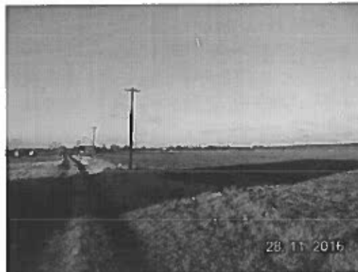
Értékelt ingatlanok villanyvezeték sortól jobbra.